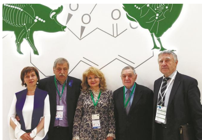
Члены конкурсной комиссии на стенде ООО «ЕВРОВЕТФАРМ»