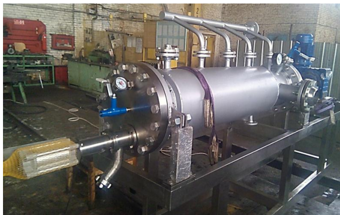
Гидролизер для мягкого сыра