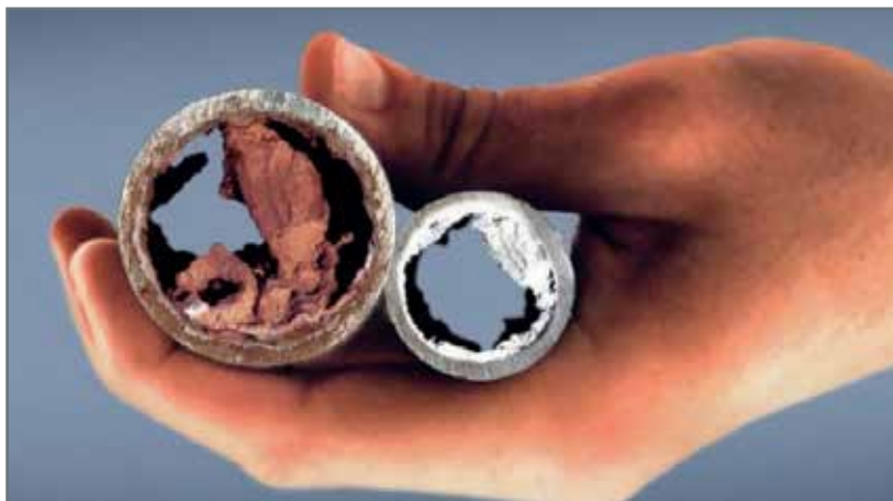
Отложения в трубах ухудшают работу системы водоснабжения на животноводческих фермах

Сельскохозяйственные птицы потребляют больше воды, чем корма, поэтому крайне важно обращать внимание на качество питьевой воды. Специалисты постоянно работают над улучшением состава и дозирования кормов, но о качестве воды иногда забывают. Игнорирование микробиологических показателей питьевой воды для животных может привести к снижению их продуктивности, увеличению заболеваемости и даже смертности. Если в производственной деятельности хозяйства не применяется программа очистки или санитарной обработки питьевой воды, то бактерии, присутствующие в ней, могут оставлять налет на обработанных водой поверхностях, что создает идеальные условия для образования биопленки. Минеральные отложения, формирующиеся из-за применения жесткой воды, также повышают риск появления биопленки. Морские водоросли и дрожжевые грибки способны привести к образованию мутных и слизистых слоев, прилипающих к отложениям.