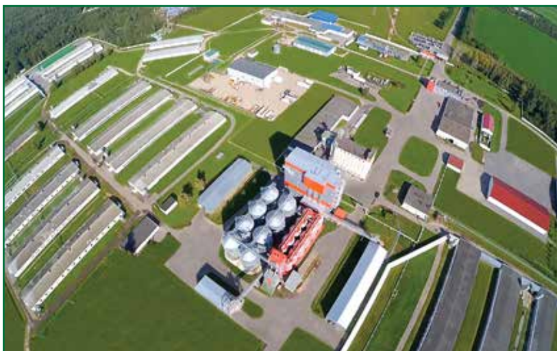
Современный вид ОАО «Волжанин»