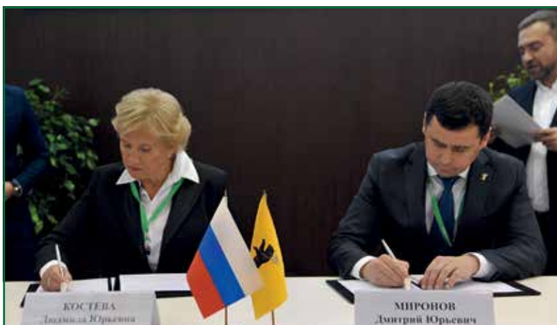
Л. Ю. Костева и и. о. губернатора Ярославской области Д. Ю. Миронов подписывают соглашение о сотрудничестве, октябрь 2016 г.

комплексная программа развития с общим объемом инвестиций в размере 2,6 млрд руб.