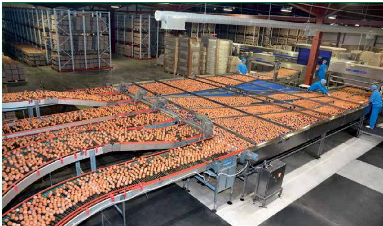
Цех сортировки и упаковки яиц

муниципальных и государственных заказов в пользу производителя, а не посредников и о субсидировании процентной ставки по кредитам для крупных компаний на приобретение неликвидных предприятий с целью их реанимирования. Председателю Правительства РФ Владимиру Путину. Он заинтересовался этими предложениями и дал соответствующие поручения правительству.