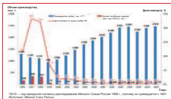
Рис. 1. Динамика производства и импорта колбасных изделий в России

С учетом повышения общего уровня цен на импортируемые мясопродукты с 1998 г. (когда вводились отечественные выше специфические составляющие импортных пошлин) к моменту «либерализации» к 2015 г.