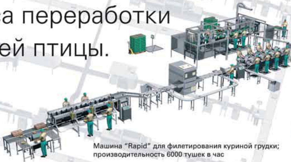
Машина "Rapid" для филетирования куриной грудки; производительность 6000 тушек в час