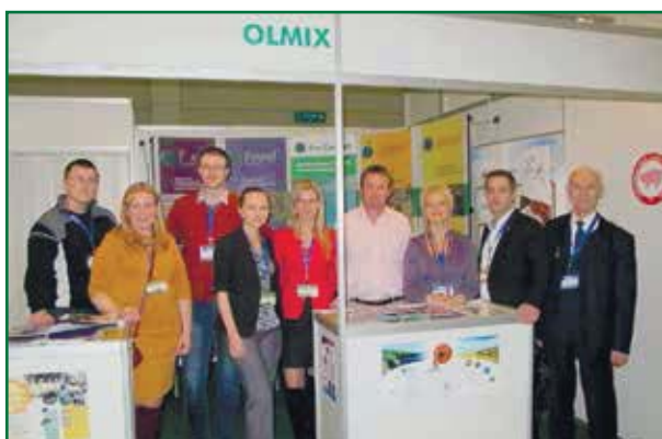
Стенд компании «Олмикс»