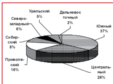
Рис. 1. Удельный вес федеральных округов в Клубе «Агро-300» за 2006–2008 гг.

В клубе «Агро-300» представлены хозяйства из 55 субъектов РФ (рис. 1).